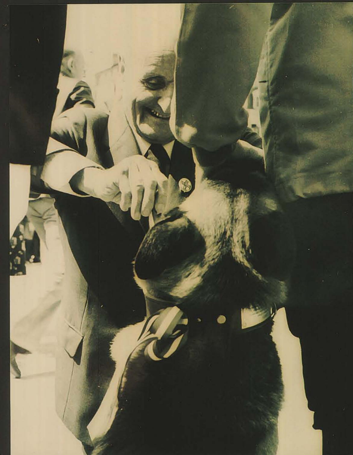
1978 REMISE DE LA MEDAILLE DE SAUVETAGE à CHIEN DE LA GENDARMERIE